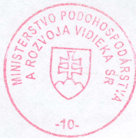
Lubomír Jahnátek minister

organizácia sa zriaďuje na dobu neurčitú.