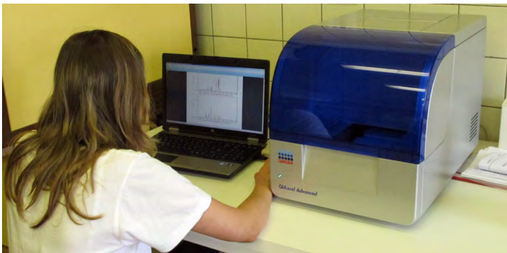
Analýza fragmentov DNA

Ku kontaminácii potravín môže dochádzať týmito hlavnými cestami: