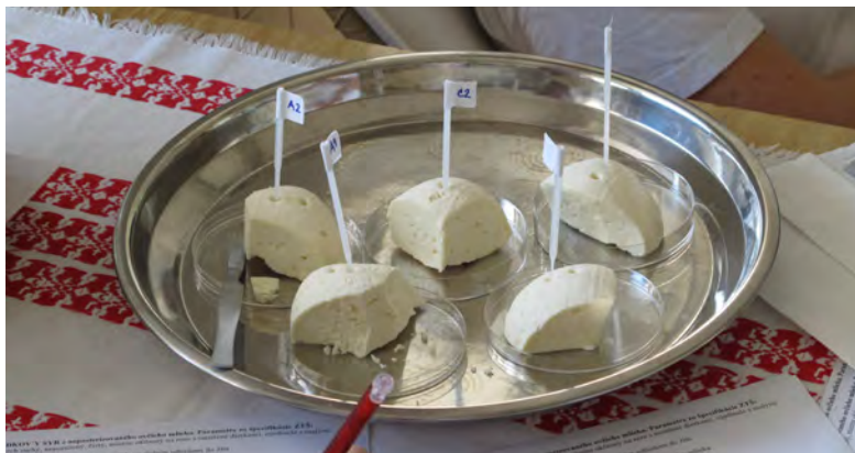
Vzorky ovčieho hrudkového syra na senzorickú analýzu

Tento príspevok bol vytvorený realizáciou projektu Agentúry na podporu výskumu a vývoja APVV-15-0006 „Zvýšenie bezpečnosti a kvality tradičných slovenských syrov na základe aplikácie moderných analytických, matematicko-modelovacích a molekulárno-biologických metód a identifikácia inovačného potenciálu“.