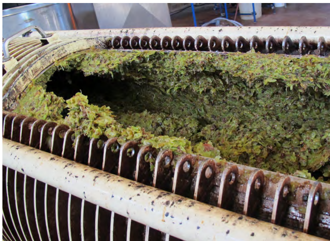
Zostatok po vylisovaní rmutu