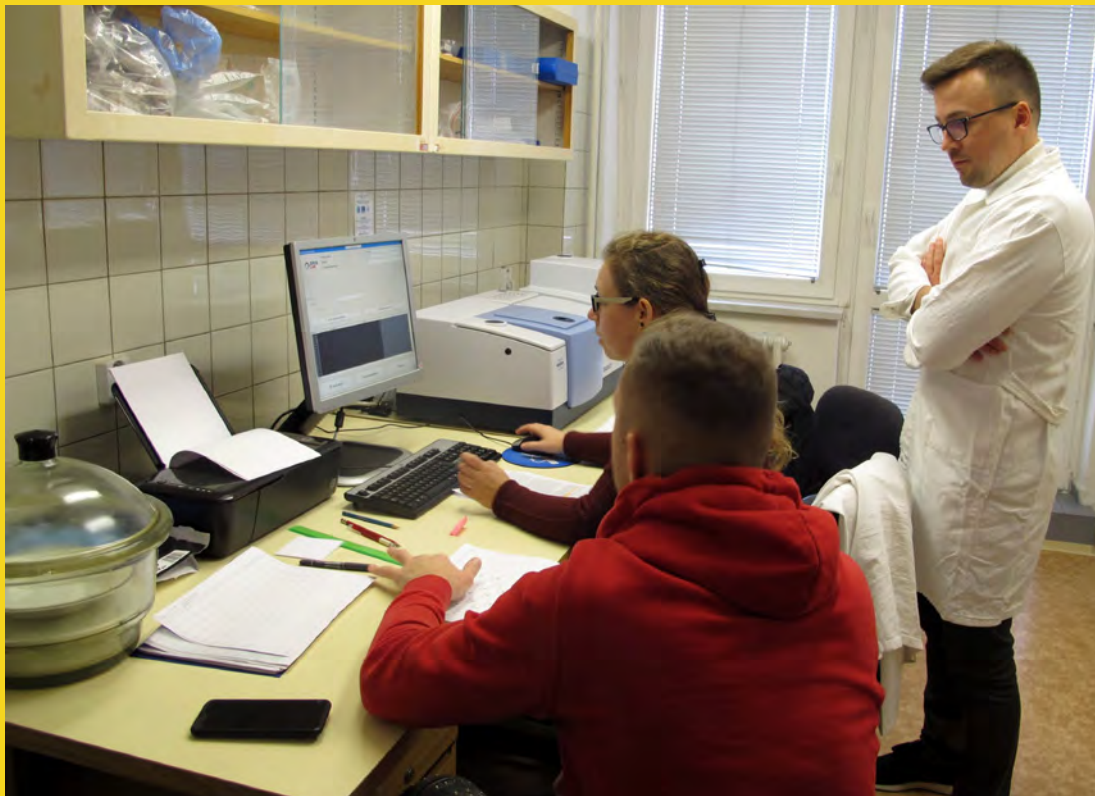
Predbežná identifikácia kmeňov v zbierke vínnych kvasiniek pomocou FTIR spektroskopie