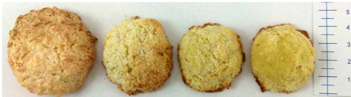
Obr. 1. Kokosky s prídavkom okary.

Aplikáciou okary do pekárskeho produktu za účelom zvýšenia obsahu vlákniny v nich sa zaoberal aj výskumný tím NPPC VÚP. Okara bola pred použitím skladovaná pri teplote -18\text{ }^{\circ}\text{C} . Vločkovitá štruktúra okary a neutrálna chuť predisponovala jej uplatnenie v cukrárskom výrobku – kokoskách. Kokos v receptúre bol nahradený mokrou okarou v podiele 0 %, 50 %, 75 % a 100 % (Obr. 1). Hotové produkty boli charakterizované z hľadiska fyzikálno-chemických parametrov a sensorického hodnotenia. Preferenčný test ukázal, že najlepšie hodnotenou vzorkou bola kokoska s obsahom 50 % okary. Táto vzorka obsahovala približne 12 g celkovej potravinovej vlákniny na 100 g výrobku.