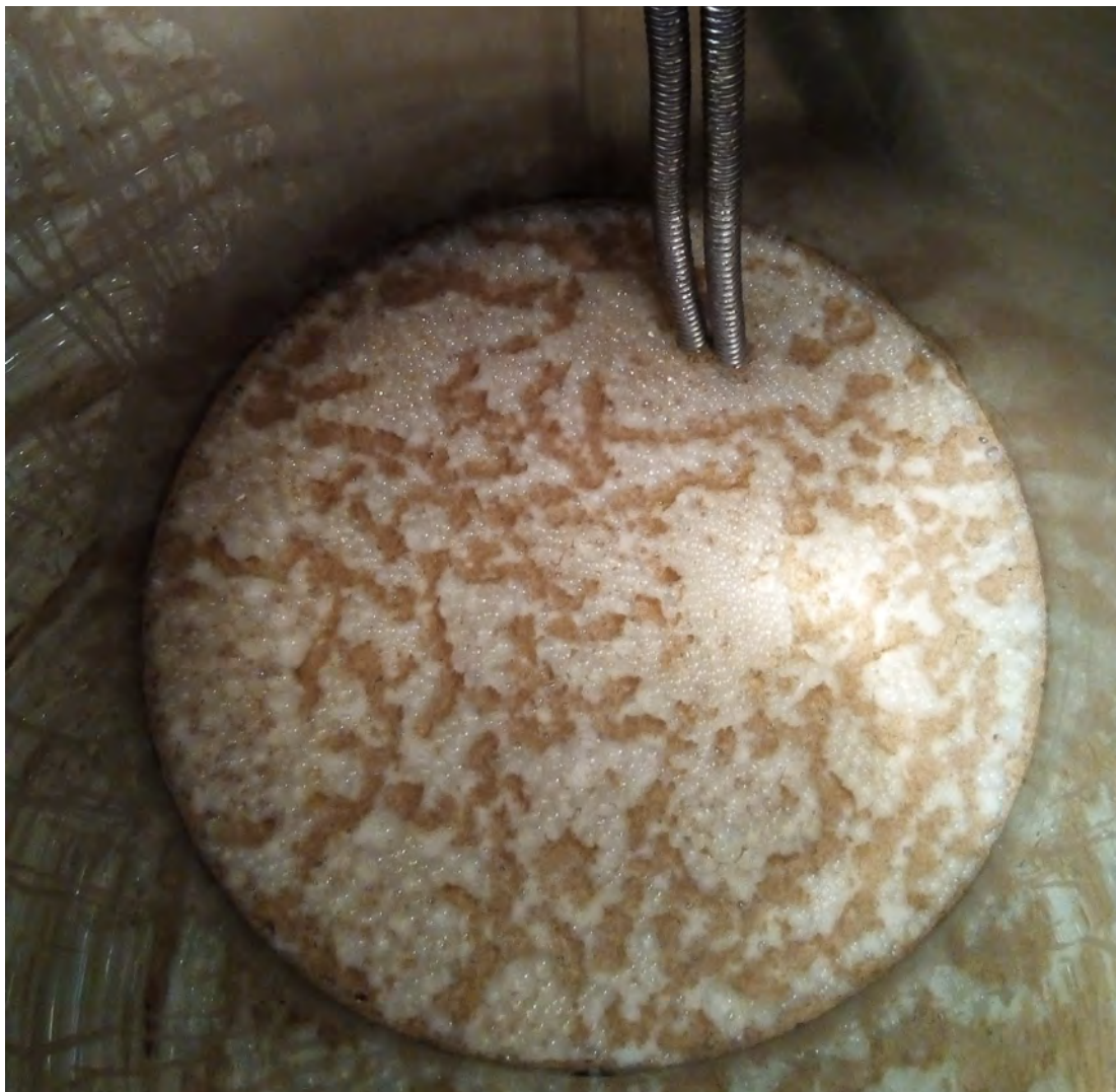
Fermentácia hroznového muštu s chladiacim zariadením