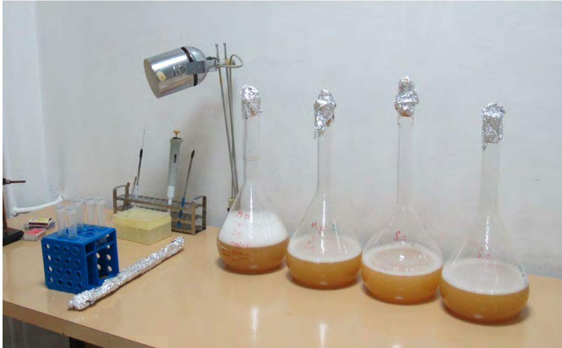
Príprava inokula pre experimentálnu výrobu vína