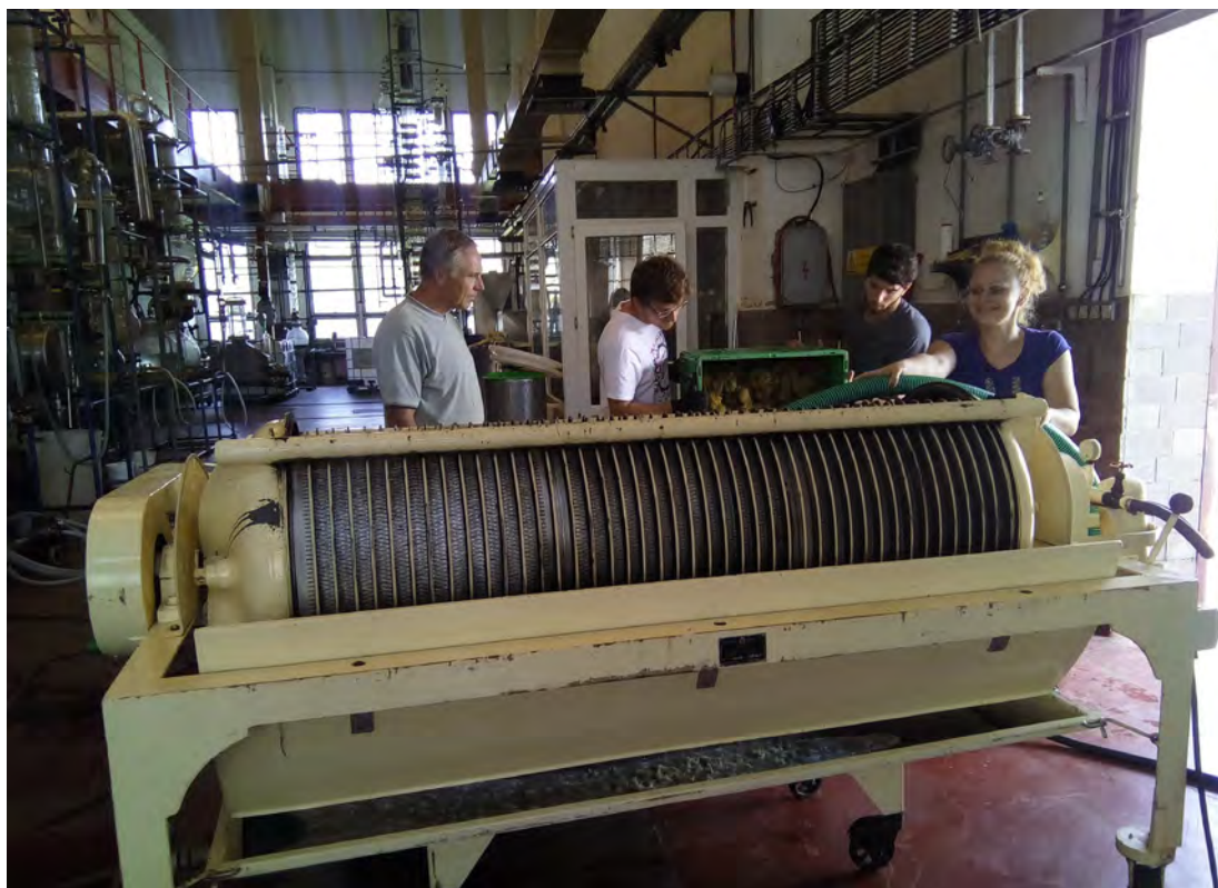
Plenie lisu pomletým odstopkovaným hroznom