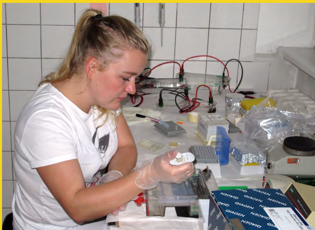
Elektroforetická analýza vzoriek DNA po amplifikácii markérov baktérií mliečneho kysnutia