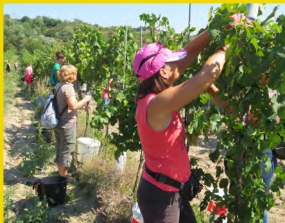
Zber hrozna typickej malokarpatskej odrody Rulandské biele